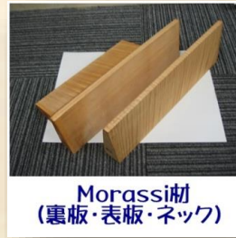
Morassi材 (裏板・表板・ネック)