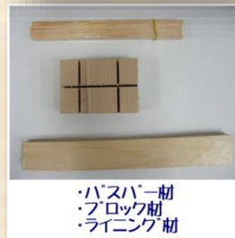
・バスバー材 ・ブロック材 ・ラインゲ材